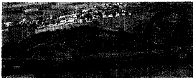
L'ambiente. Esempio di inserimento ambientale della Brebemi nell'area compresa tra il casello di Treviglio Est-Caravaggio e l'autostrada