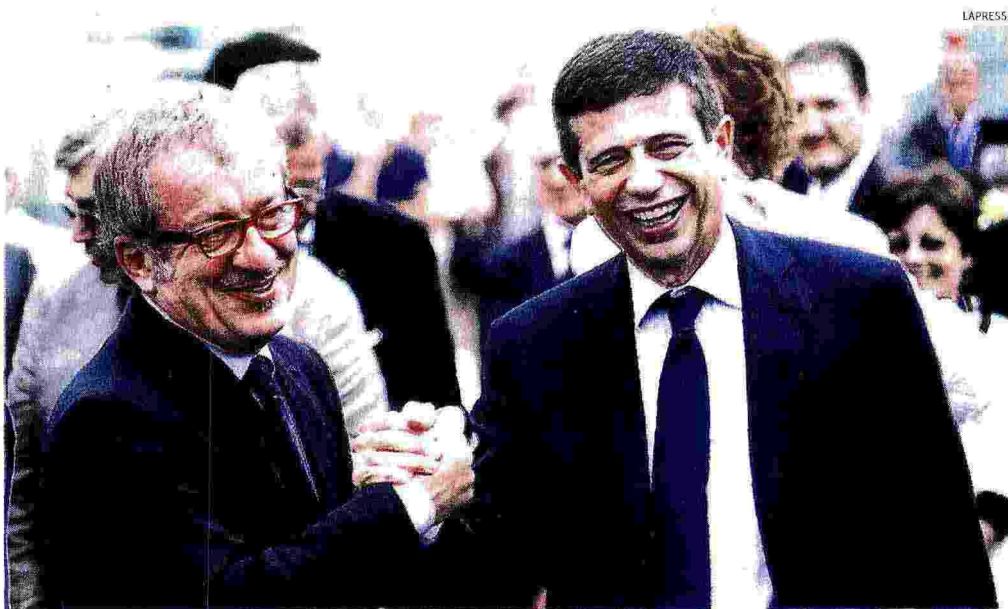
Inaugurazione. Da sinistra il governatore lombardo Roberto Maroni e il ministro Maurizio Lupi

La richiesta alternativa La società chiede un contributo pubblico, in assenza di defiscalizzazione