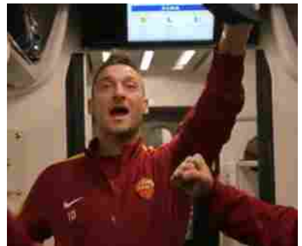
Totti "capotreno" sul Frecciarossa