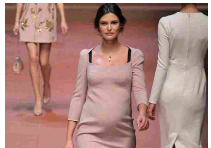
Milano Fashion, mamma D&G e Barzini: musa a 71 anni per Marras