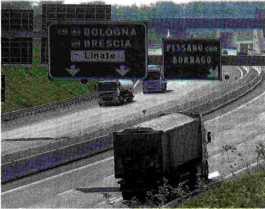
Lo svincolo L'uscita di Pessano con Bornago (provincia di Milano) sul tracciato della Teem