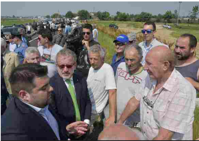
Maroni e Sorte parlano con un gruppo di agricoltori a cui hanno espropriato i terreni per la Brebemi

Il governatore della Lombardia Roberto Maroni ha inaugurato oggi 11 giugno, a Isso, la bretella stradale Camisano-Romano di Lombardia (8 chilometri) e la Morengo-Bariano (2,2 chilometri). Le due opere, costate in tutto 44 milioni di euro, serviranno a migliorare i collegamenti tra l'autostrada Brebemi e le province di Bergamo e Cremona. «Siamo qui - commenta Maroni - per continuare l'opera di infrastrutturazione in Lombardia, opera iniziata con la Brebemi, la tratta A della Pedemontana, le tangenziali di Varese e Como, la Teem e che continueremo, a novembre, con la tratta B1 della Pedemontana, che completeremo tutta. Uno alla volta risolviamo tutti i problemi delle infrastrutture. Vogliamo collegare meglio la Brebemi con gli svincoli, per collegarla direttamente alla Milano-Venezia e mi pare che stiamo procedendo come da cronoprogramma nella realizzazione delle opere,