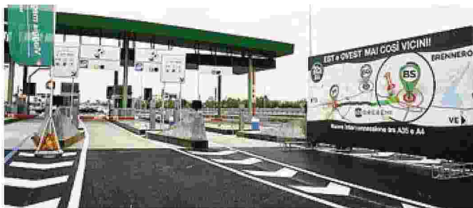
Il casello d'ingresso alla Brebemi dalla A4 a Brescia

L'inaugurazione, ieri, dell'interconnessione, nel Bresciano, fra la Brebemi-A35 e l'A4 Milano-Venezia è stata molto di più. Per l'assessore regionale alle Infrastrutture e mobilità Alessandro Sorte si è inaugurata la Brebemi, cioè il progetto dell'A35 è arrivato ad essere completato come originariamente pensato. Con l'apertura di questo nuovo tratto al traffico, ieri sera