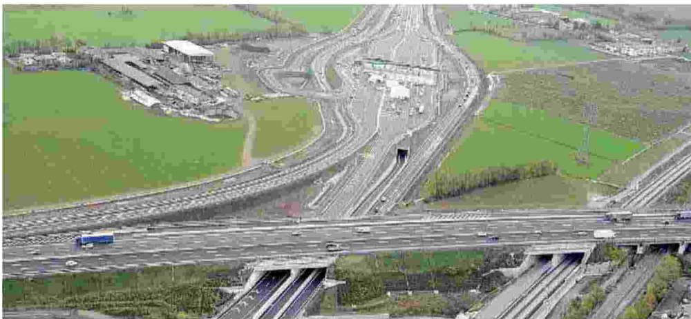
Collegate. Inaugurato in mattinata dal ministro Delrio, il raccordo A4-A35 è aperto da ieri sera

Per il ministro Graziano Delrio l'opera è «utile per lo sviluppo del territorio». Con il raccordo la società stima un aumento del traffico del 30-40%. Numeri che avvicinano il pareggio di bilancio, previsto nel 2019. A PAGINA 10 E 11