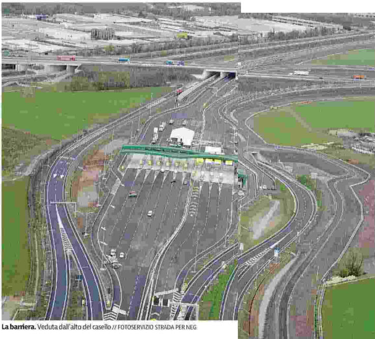
La barriera. Veduta dall'alto del casello