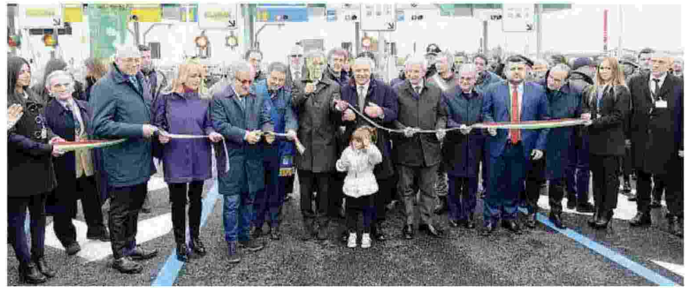
Taglio del nastro. La cerimonia di inaugurazione del nuovo casello a Castegnato che collega la A35 e la A4