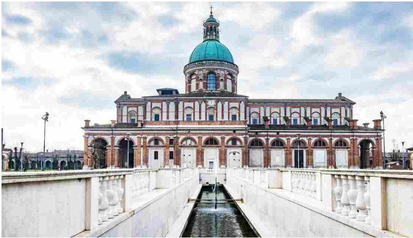
Il Santuario di Caravaggio

Palazzo della Marchesa), uno degli edifici più antichi della città che risale alla seconda metà del XIII secolo, o Villa Clelia, cinta da un murone, che si apre all'interno del parco o l' Arco di Porta Nuova , che adorna uno degli ingressi al centro storico della città e da cui parte un bellissimo viale alberato lungo circa due chilometri che collega il centro di Caravaggio con il Santuario. È in progetto anche un museo dedicato al Caravaggio, che sarà aperto nei prossimi anni.