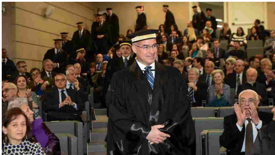
Il rettore Ferruccio Resta

Un nuovo corso di laurea per andare incontro ai cambiamenti del mondo del lavoro