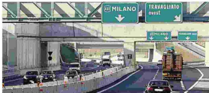
L'autostrada A35 (Brebemi) che collega Brescia con Milano

Diciotto insediamenti logistico-produttivi, 3.620 nuovi dipendenti, 22,6 milioni di euro di oneri di urbanizzazione incassati dai Comuni. Sono alcune delle «Ricadute economiche, occupazionali e ambientali di A35 sul territorio», raccolte in uno studio presentato ieri in Regione. L'obiettivo era valutare l'impatto anche «indiretto» della Brebemi sul territorio. Tra i 15 Comuni presi in esame dalla