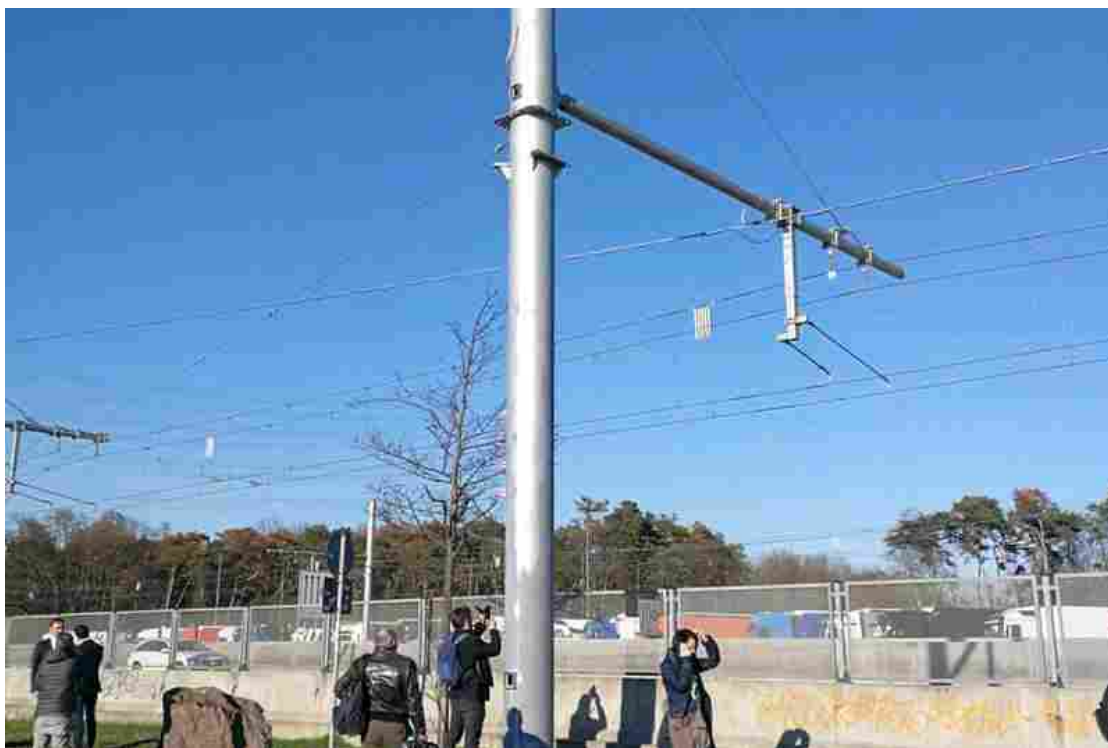
I pali e le linee di contatto per la distribuzione dell'energia - Foto © www.giornaledibrescia.it