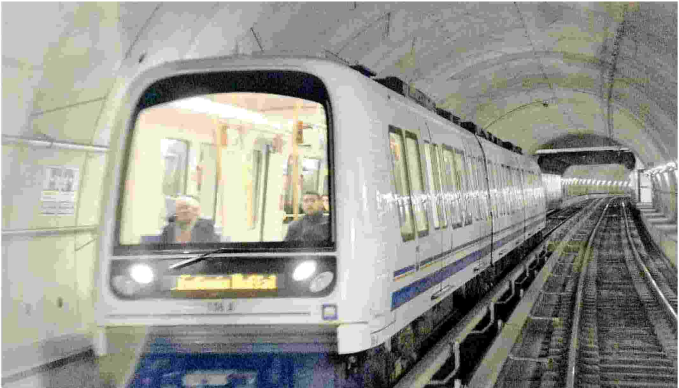
Metropolitana. Inaugurata il 2 marzo 2013, l'opera ha trasportato oltre 110 milioni di passeggeri, facendo crescere gli utenti del Tpl del 37%