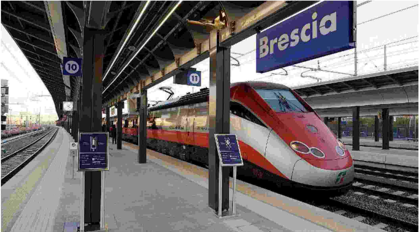
Alta velocità. Il 10 dicembre 2016 è stata inaugurata la tratta Treviglio-Brescia, completando il collegamento con Milano