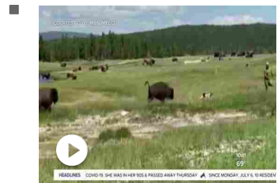
Usa, donna sfugge alla carica del bisonte fingendosi morta: ...