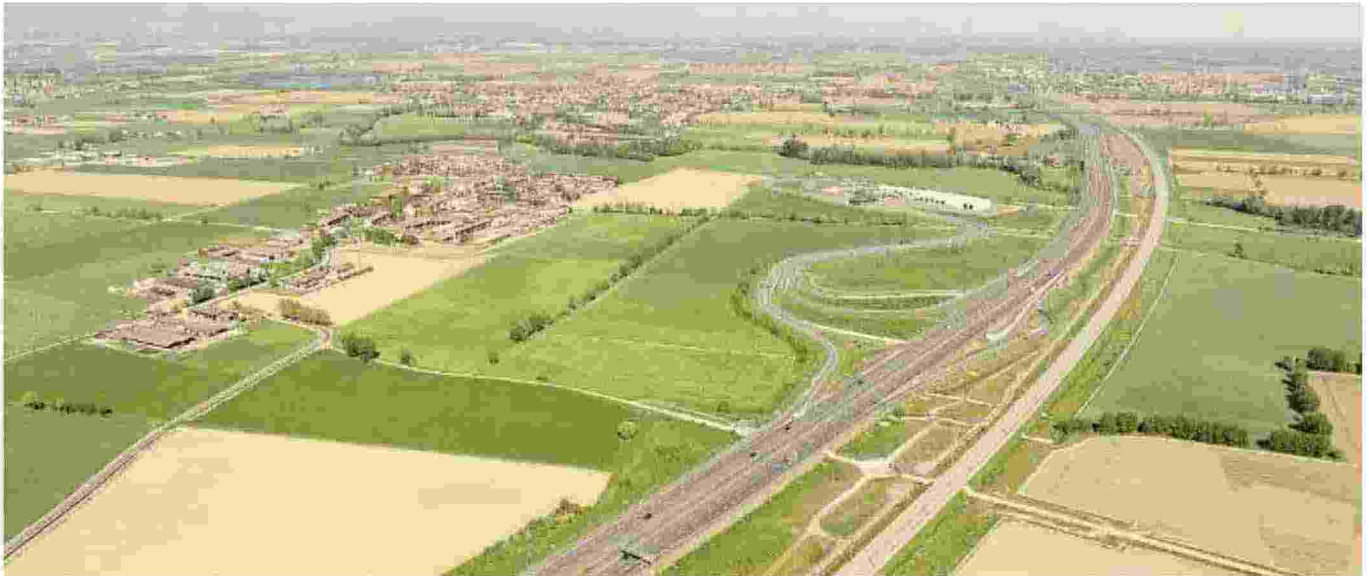
Nel paesaggio. L'autostrada Brebemi attraversa l'Ovest bresciano e la bassa pianura bergamasca ricchi di paesi, di storia e di arte