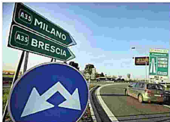
L'infrastruttura Brebemi è stata inaugurata il 23 luglio 2014.