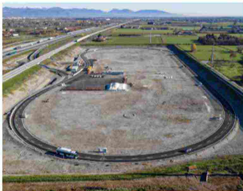
Il circuito ha una lunghezza di 1.050 metri. È alimentato con una potenza elettrica di 1 MW.

Il progetto compie oggi un passo estremamente concreto e importante con "Arena del Futuro" pronta a ospitare le varie fasi di test su questa tecnologia, recentemente inserita dalla prestigiosa rivista TIME come una delle 100 invenzioni più importanti del 2021.