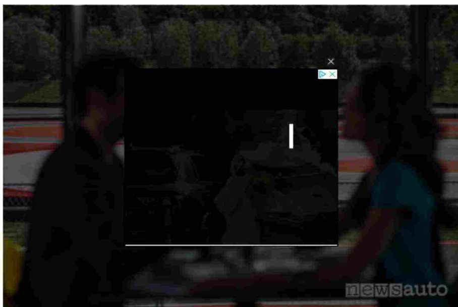
Ristorante panoramico nel Porsche Experience Center di Franciacorta

Il Customer Center misura 5.600 mq ed è composto da una agorà centrale dalla quale si dipanano i vari servizi: sale briefing per le sessioni teoriche, uno showroom per la configurazione delle vetture dove è possibile richiedere la consegna della propria Porsche ordinata presso il concessionario, un elegante ristorante panoramico a sbalzo sull'autodromo, uno shop, un'area Kids, un bar e un'ampia terrazza panoramica.