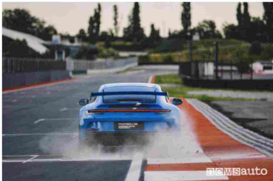
La pista di Franciacorta è il cuore del del Porsche Experience Center

Il Paddock, comprensivo di un pit building dotato di 29 box, è invece l'area del Porsche Experience Center di Franciacorta dedicata ad ospitare i grandi eventi motoristici, a partire dal campionato monomarca Porsche Carrera Cup Italia .