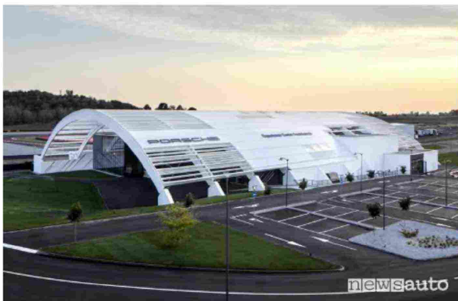
Struttura ad archi, d'ingresso al Porsche Experience Center di Franciacorta

Inoltre, il PEC Franciacorta ha già ottenuto la certificazione ISO 20121 , lo standard internazionale per i sistemi di gestione degli eventi secondo i criteri di sostenibilità.