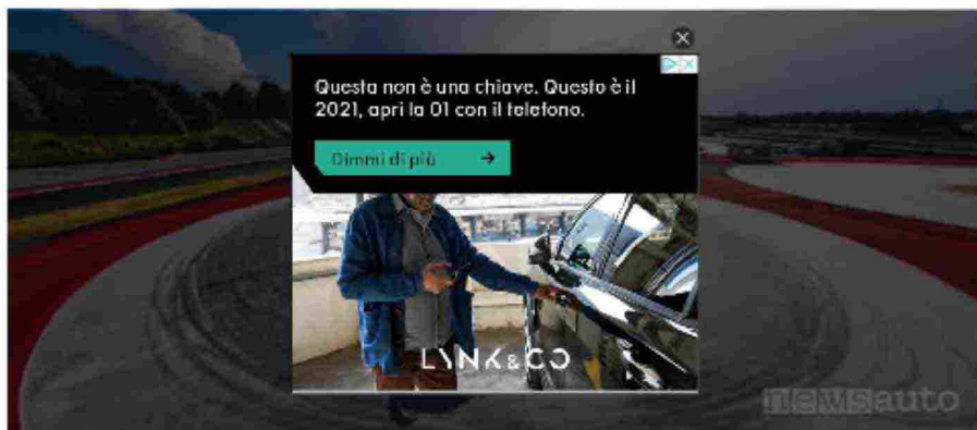
Area di guida sicura nel Porsche Experience Center di Franciacorta

L'area di guida sicura comprende una pista a bassa aderenza dove sperimentare sbandate, sovrasterzi e pendoli, un anello irrigabile in cemento levigato, perfetto per affinare la tecnica di controllo di sovra e sottosterzo e un'ampia sezione dove saggiare l'efficienza degli impianti frenanti e la stabilità dell'auto nelle manovre d'emergenza.