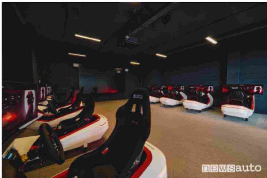
Simulation Lab all'interno del Porsche Experience Center di Franciacorta

Entro la fine dell'anno sarà inoltre completato il nuovo Training Center di Porsche Italia, dedicato alle attività di formazione della rete di concessionari . In questa struttura è prevista un'ampia vetrata per consentire ai visitatori più curiosi di assistere alle sessioni di formazione.