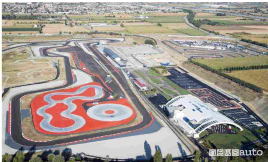
Vista dall'alto del Porsche Experience Center di Franciacorta

Il PEC italiano è l'ottavo e il più grande Porsche Experience Center al mondo. Gli altri sette Porsche Experience Center si trovano a Lipsia, Silverstone, Atlanta, Le Mans, Los Angeles, Shanghai, Hockenheim.