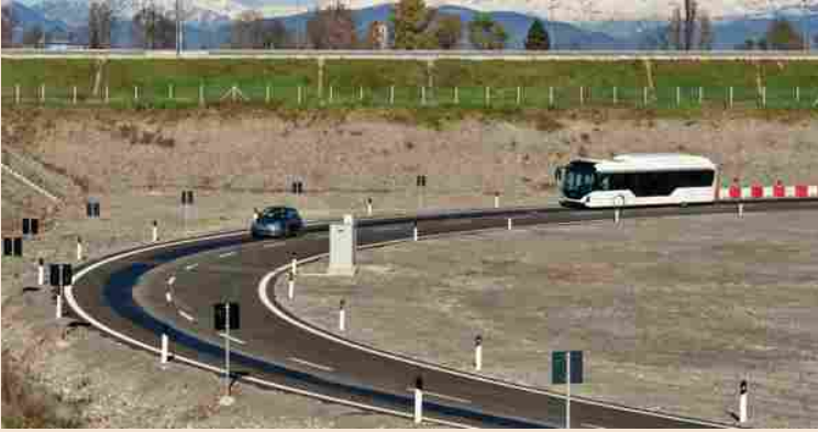
▲ Arena del futuro