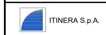
TAVOLA CANTIERIZZAZIONE DEMOLIZIONE SOVRAPPASSO SAN BERNARDO